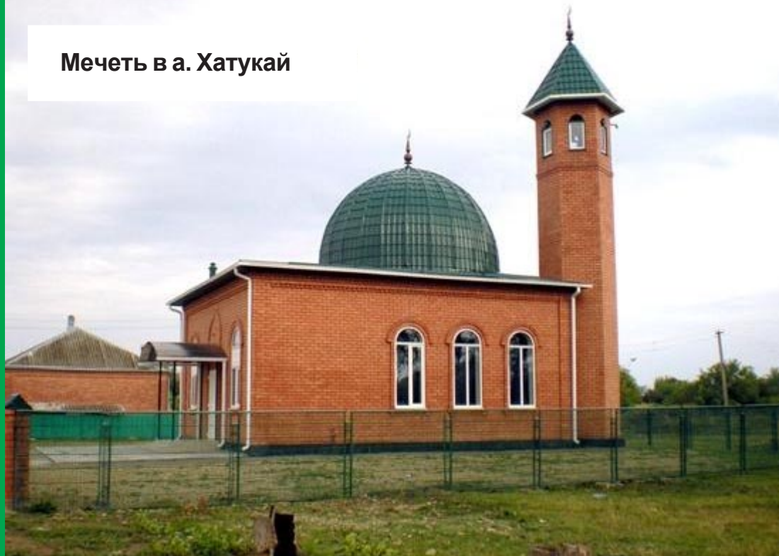
Мечеть в а. Хатукай