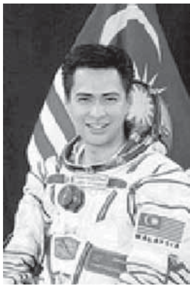
Музафар перед полетом

Музафар хочет, чтобы мусульманские страны также проявляли более живой интерес к космическим технологиям. Больше мусульман должны выходить в космос, и чтобы достигнуть этого, Музафар предложил идею создания Исламского космического агентства, в реализации которой сотрудничает с четырьмя другими мусульманскими космонавтами.