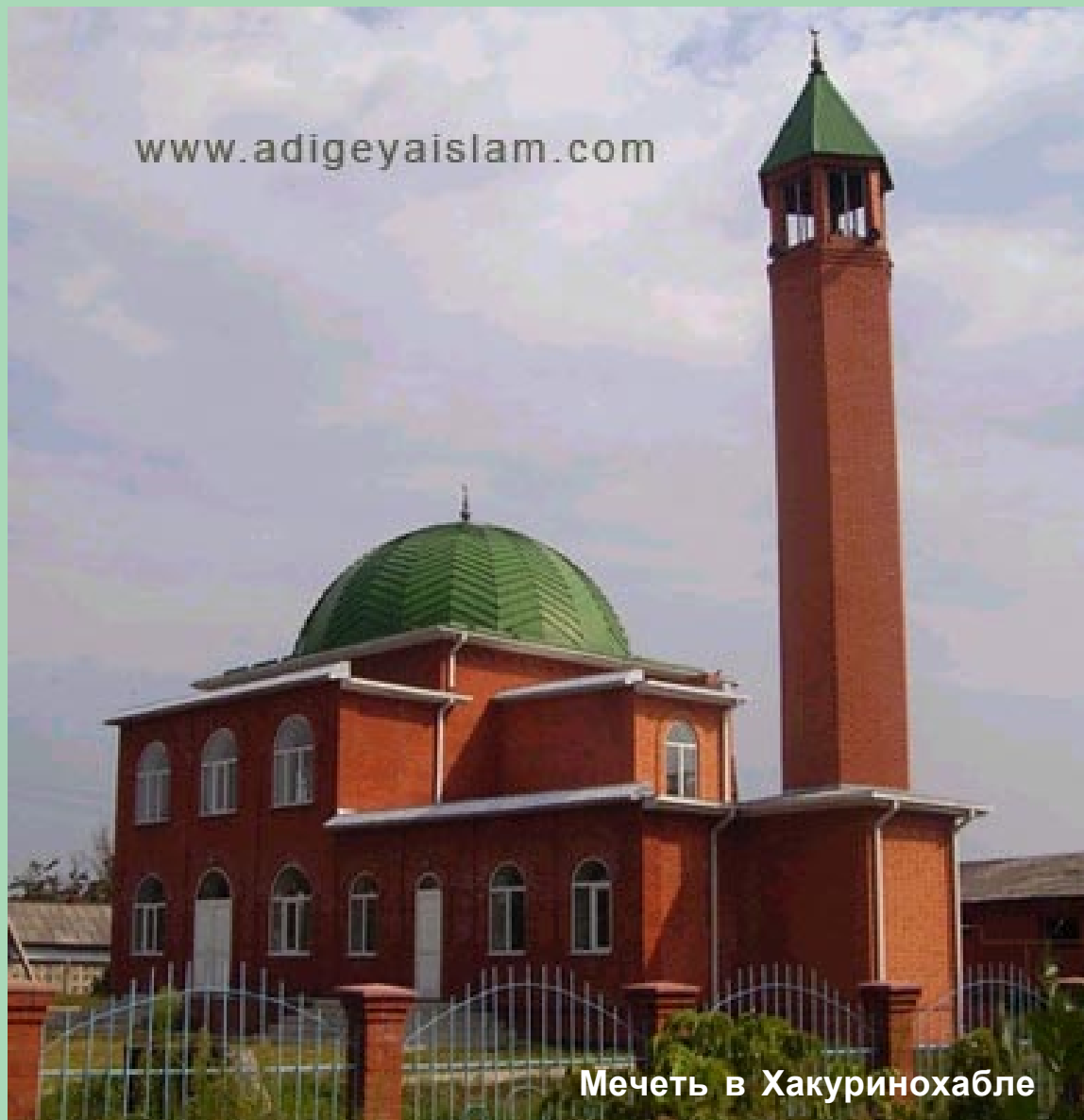
Мечеть в Хакуринохабле

«Если вы не знаете, то спросите обладателей Напоминания».