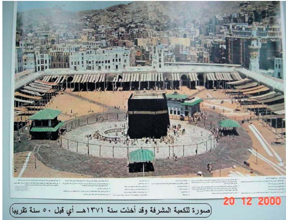
صورة للكعبة المشرفة وقد أخذت سنة ١٣٧١هـ أي قبل ٥٠ سنة تقريبا

Результаты современных исследований земли показывают, что наша планета пережила этап в своей древней истории, когда она была полностью покрыта водой и вся суша была скрыта, затем Аллах взорвал дно этого океана вулканическим извержением, которое продолжало извергать лаву, пока не образовалась на дне этого первого океана цепочка гор. Вулканическая активность продолжала наращивать эти горы, пока некоторые ее вершины не начали вырисовываться над водой. Затем они превращаются в цепь вулканических островов, из которых например, состоят такие государства как Гавайи, Япония, Филиппины, Индонезия и другие.